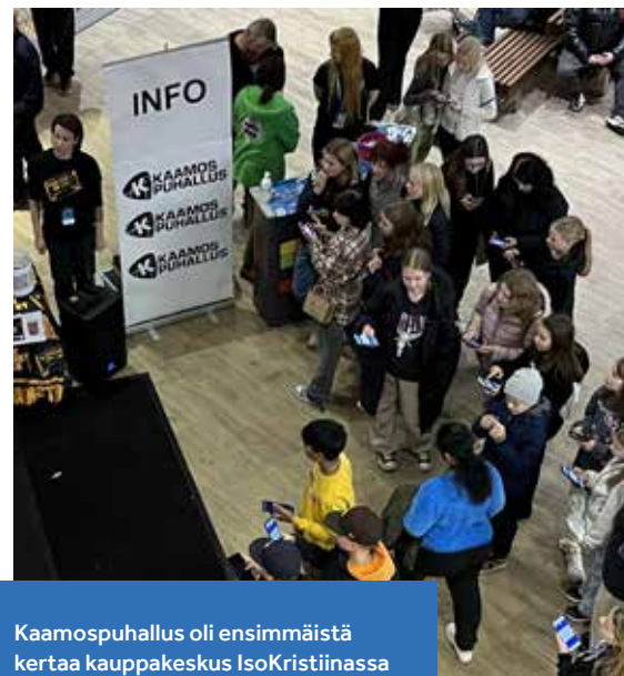
Kaamospuhallus oli ensimmäistä kertaa kauppakeskus IsoKristiinassa syksyllä 2023.